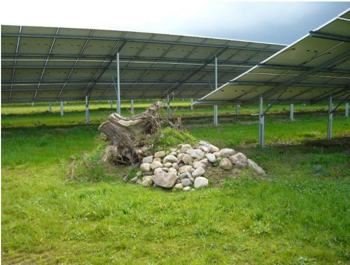
Abb. 17: Totholz- und Lesesteinhaufen – gut gemeint, aber auch gut gemacht? Freiflächen in Solarparks sollten möglichst naturnah gestaltet werden, aber nicht zu einem Freilandzoo oder botanischen Garten.