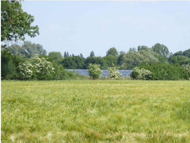
Abb. 2: Mit der Standortwahl der FF-PV wurde vom Aufnahmestandort aus betrachtet eine Integration in das Landschaftsbild ohne Neuanpflanzungen erreicht.