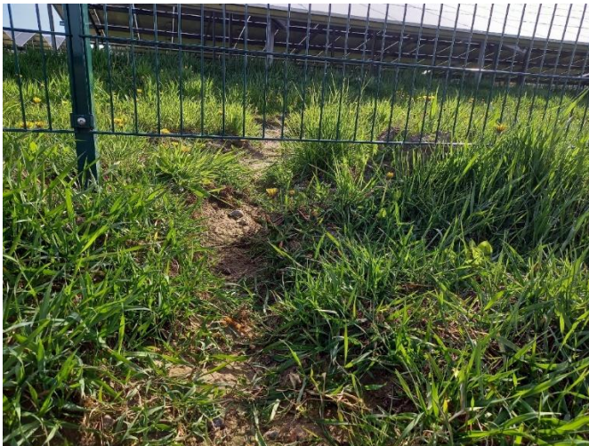
Abb. 6: Zwischen Grundfläche und Zaun passt immerhin ein Fuchs. Die Durchlässigkeit von Zäunen für wildlebende Tierarten sollte planerisch gewährleistet werden und nicht dem Zufall überlassen bleiben.