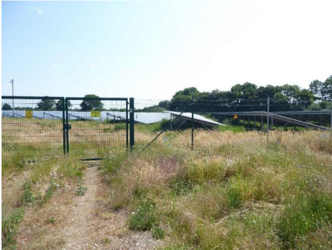
Abb. 5: Zäune verstärken den technischen Charakter von Solarparks. Mit einer Bepflanzung aus standortheimischen Gehölzen könnten die negativen Auswirkungen auf das Landschaftsbild deutlich reduziert oder vollständig behoben werden. Im vorliegenden Beispiel scheint der Platz für eine solche Anpflanzung durchaus vorhanden zu sein.