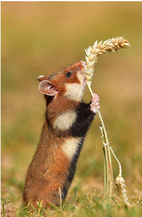
Abb. 15: In den Lebensräumen des vom Aussterben bedrohten Feldhamsters sollten keine Solarparks errichtet werden. Selbst wenn die Freiflächen zwischen den Anlagenreihen als Kompensationsflächen feldhamstergerecht bewirtschaftet würden, wären diese eher eine ökologische Falle, weil Greifvögel die Module als Ansitzwarte für die Jagd nutzen können.