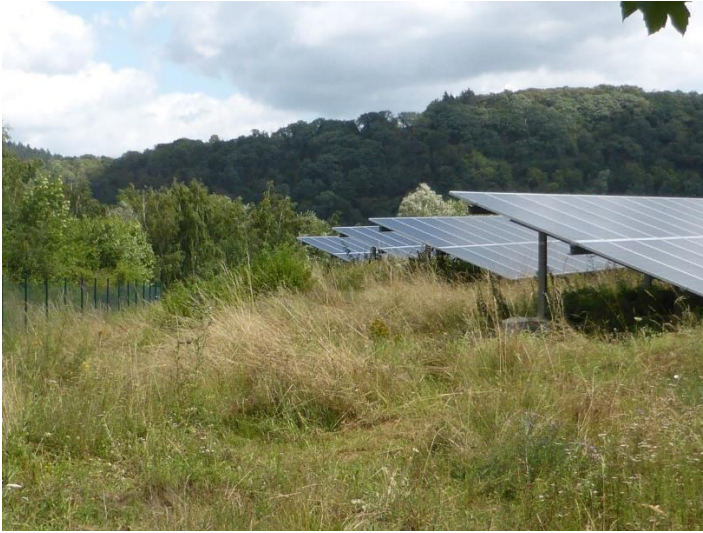
Abb. 16: Beispiel für eine gut in die Umgebung integrierte FF-PV. Die Freiflächen können sich naturnah entwickeln; sie werden einmal jährlich gemäht. Das Mähgut wird abtransportiert.