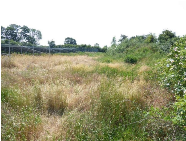
Abb. 3: Der Gehölzstreifen rechts im Bild trägt zu einer Eingrünung der FF-PV bei. Der Abstand der Gehölze ist so groß, dass der Energieertrag der Anlagen nicht durch Schattenwurf gemindert wird. Die Fläche zwischen Anlagen und Gehölzen kann zu wertvollen Biototypen entwickelt und so die mit den Modulen für Boden und Biotope verbundenen erheblichen Beeinträchtigungen der Leistungs- und Funktionsfähigkeit des Naturhaushalts kompensiert werden.