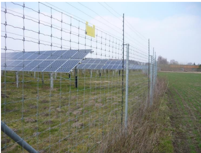
Abb. 4: FF-PV ohne Maßnahmen des Naturschutzes und der Landschaftspflege, welche die mit den Anlagen verbundenen erheblichen Beeinträchtigungen des Landschaftsbildes kompensieren könnten. Die Fläche entlang des Zaunes innerhalb der Anlage dürfte für die Anpflanzung von Gehölzen, die zu einer landschaftsgerechten Wiederherstellung führen könnten, kaum genügen. Problematisch ist zudem die Einzäunung. Sie reicht bis auf den Boden und umfasst auch einen Elektrozaun. Selbst für ein Kaninchen gibt es kein Durchkommen.