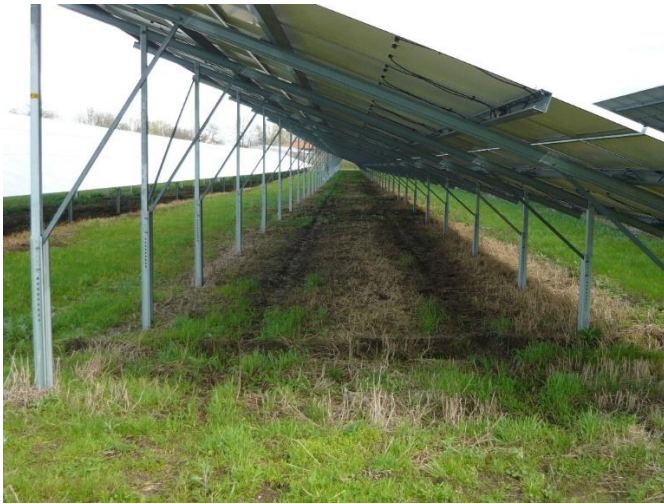
Abb. 7: Während für FF-PV kaum Fläche versiegelt wird, werden große Flächen optisch massiv überprägt und die natürlichen Bodenfunktionen infolge der Verschattung erheblich beeinträchtigt. Unter den Anlagen sind deswegen die Voraussetzungen für die Entwicklung wertvoller Lebensraumtypen des Grünlandes begrenzt.