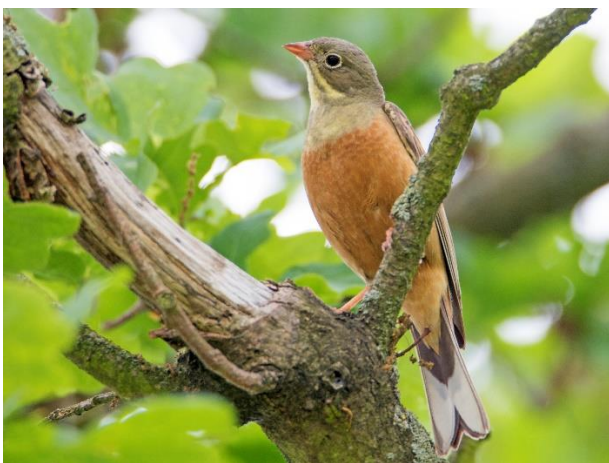
Abb. 12: Der Ortolan mag die Module von Solarparks vereinzelt als Singwarte nutzen können, aber die darin entstehenden Grünlandbiotope eignen sich für diese Vogelart weder als Brut- noch als Nahrungshabitat.